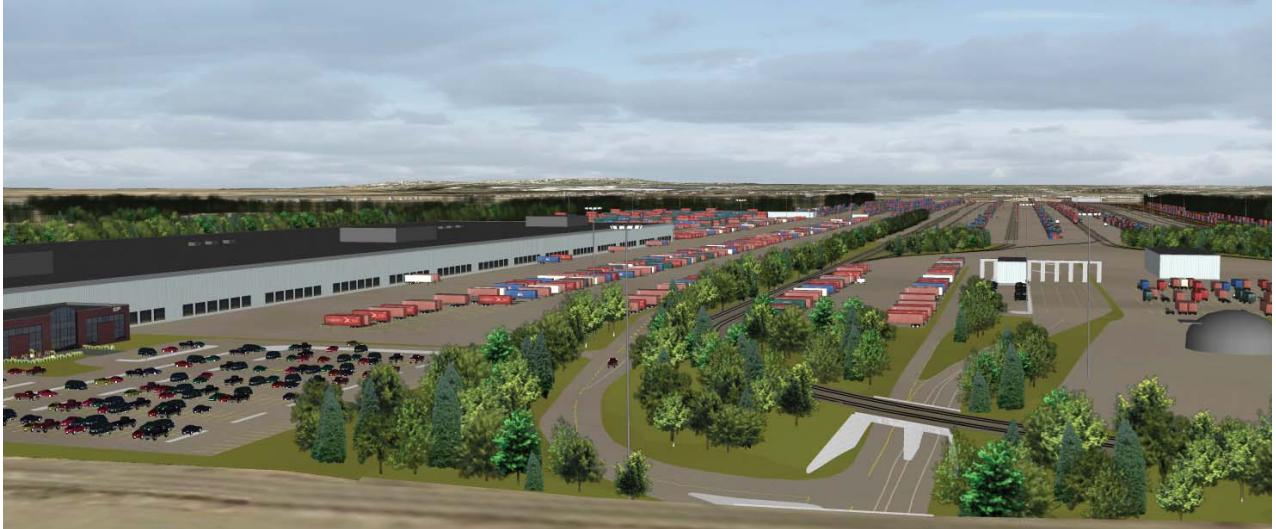
Complexe intermodal Les Cèdres

LA CROISSANCE DES IMPORTATIONS DE PRODUITS MANUFACTURÉS EN PROVENANCE DE L'ASIE ENTRAÎNE UNE DEMANDE SIGNIFICATIVE EN INFRASTRUCTURES DE TRANSPORT. DE PLUS EN PLUS DE PRODUITS DE CONSOMMATION COURANTE, TELS LES APPAREILS ÉLECTRONIQUES ET ÉLECTROMÉNAGERS, PROVIENNENT DE L'ASIE ET DOIVENT UNE FOIS ARRIVÉS AU PAYS ÊTRE ACHÉMINÉS À L'ENSEMBLE DES CONSOMMATEURS CANADIENS. LES INSTALLATIONS ACTUELLES DU CP À MONTRÉAL AYANT ATTEINT LEUR PLEINE CAPACITÉ, LE DÉVELOPPEMENT DE NOUVELLES INFRASTRUCTURES EST AUJOURD'HUI ESSENTIEL POUR DESSERVIR LA GRANDE RÉGION DE MONTRÉAL. LE PROJET DE CONSTRUCTION DU COMPLEXE INTERMODAL LES CÈDRES VISE À RÉPONDRE À CE BESOIN.